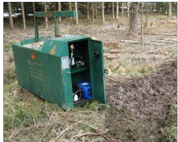
Abb. 5: Bsp. eines mobilen 1000-Liter-Dieseltanks