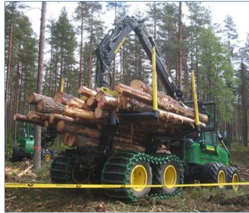
Abb. 2: Forwarder

Timberjack 1070D Harvester von Heikki Valve.