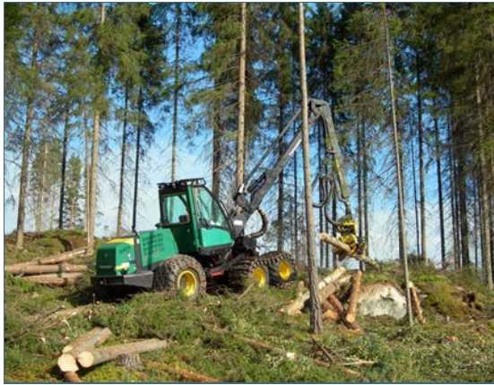
Abb. 1: Harvester

gen. Je nach Fahrwerk unterscheidet man Radharvester, Raupenharvester, Rad/Schreit-harvester oder Fahr-/Schiebeharvester. Masse: bis zu 30 t, Tankvolumen bis 1000 l, Hydraulik-ölmenge: bis zu 250 l; s. http://www.kwf-online.org/fileadmin/markt/Vollernter/vollernter.html bzw. http://www.waldwissen.net/technik/holzernte/maschinen/bfw_wissen_harvester/index_DE