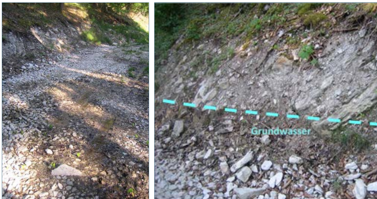
Abb. 3: Beispiel einer Freilegung von Grundwasser durch Forstwegeneubau mit nachfolgender Verkeimung einer Quelltrinkwasserversorgung (Fränkische Alb).

Von öffentlichen und privaten Wegen soll Niederschlagswasser möglichst breitflächig über die belebte Bodenzone versickern, um einen Schadstoffrückhalt zu gewährleisten. Insbesondere beim Forstwegebau kann es im Bereich von Wegseitengräben und Abschlügen zu linienhafter bis punktueller Versickerung mit entsprechend herabgesetztem Rückhaltevermögen kommen.